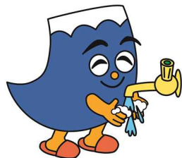
感染予防・家事負担軽減