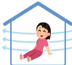
換気・省エネ など